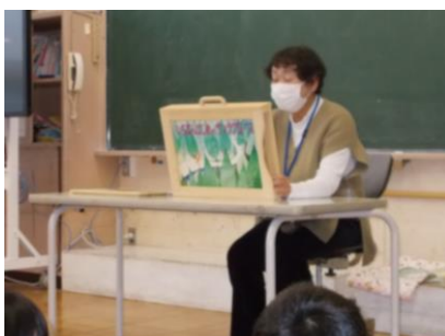
【本城山の会による読み聞かせ】

ここに挙げたものが総てではありません。どの学年の児童も多くの施設、そこで働く人達、地域の方々のお世話になりました。もちろん保護者の方の支えが一番です。1年間ありがとうございました。令和4年もどうぞよろしくお願いいたします。