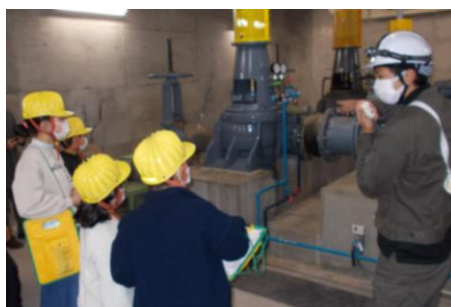
【4年生 環境施設見学】