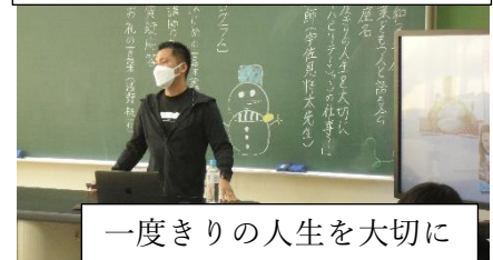
一度きりの人生を大切に