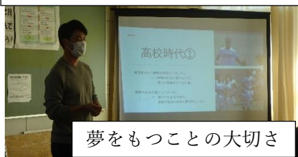
夢をもつことの大切さ