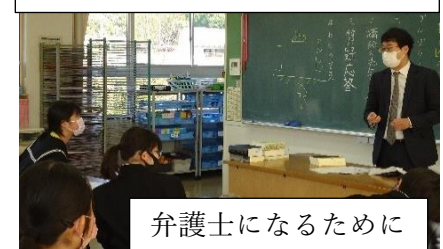
弁護士になるために