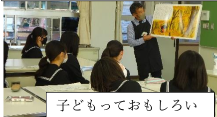
子どもっておもしろい