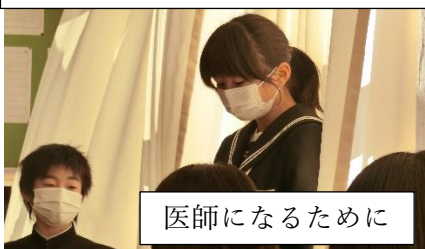
医師になるために