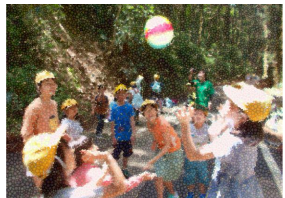
【グループで力を合わせて記録に挑戦】