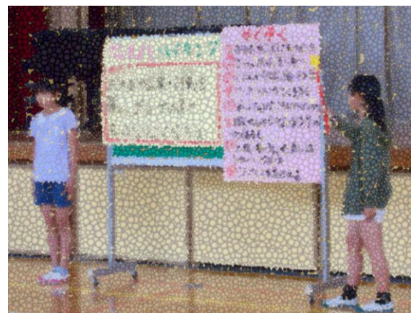
【なかよしハイキングの説明をする6年生】